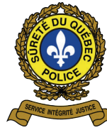
Sûreté du Québec